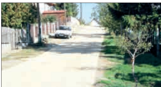
Elkezdődtek a végleges úthelyreállítások azokban az utcákban, ahol már régebben lefektették a csatornacsöveket. Mivel összesen mintegy ezer utcaszakaszon dolgoztak eddig, beletelik egy kis időbe, amíg mindenhová elérnek. A képeken az Aszú, Hárslevelű, Leányka – összefoglalóan: bornevű – utcák láthatók