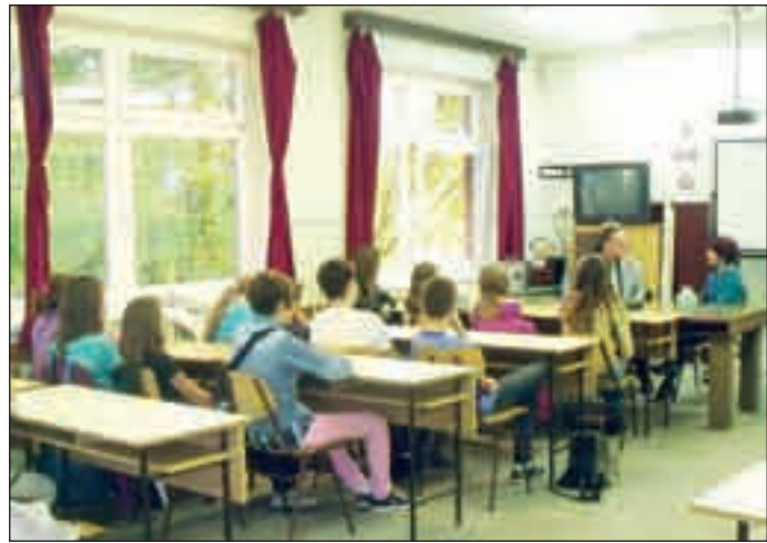
Sok tanuló volt kíváncsi az előadásra

Idén is folytatódik a kezdeményezés: a Kőrösi Csoma Sándor Általános Iskola tanulói havonta egy alkalommal kötetlenül beszélgethetnek érdi ismert – és kevésbé ismert – emberekkel, a város életét meghatározó személyekkel.