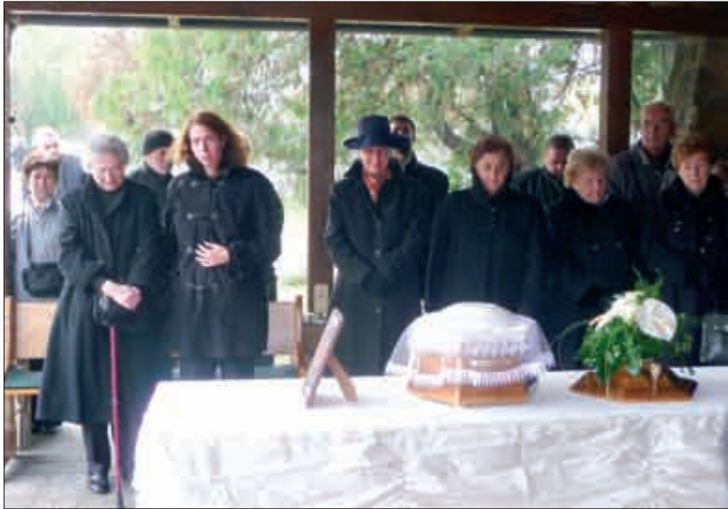
A család a ravatalnál