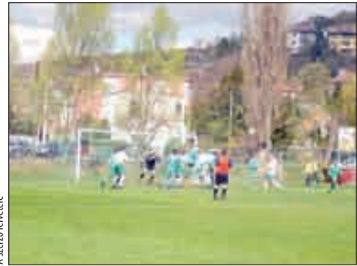
A nyomasztó érdi fölény ellenére sem sikerült nyerni (fehér mezben az Érd)

Pasaréti út, 150 néző. Vezetete: Bodac T.