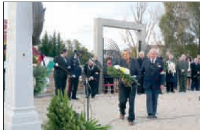
A Pofosz képviselői helyezték el a megemlékezés virágait az emlékműnél