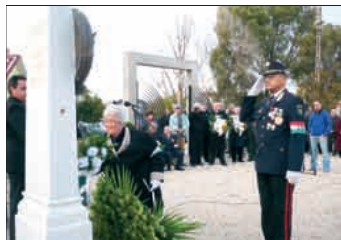
A Magyar Nemzetőrség is koszorúzott