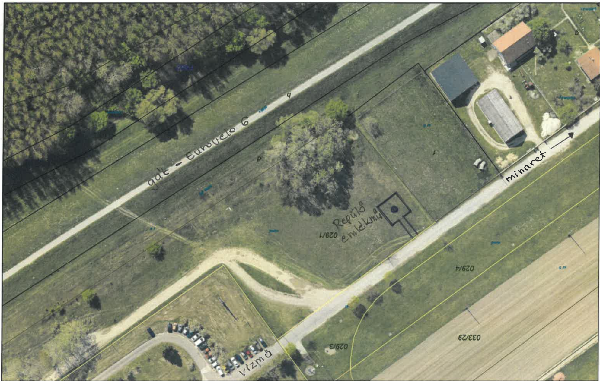
• Repülő emlékmű tervezett helye a 029/1 hrszú ingatlanon